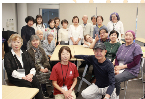
ご参加の皆さん 大変お疲れさまでした!