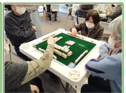
欲しい牌来るかな