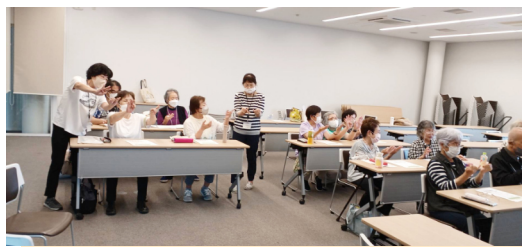
認知症予防への関心が高く、楽しく和やかにそして熱心に取り組んでいただきました