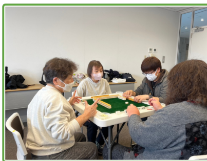
若い世代と一緒に