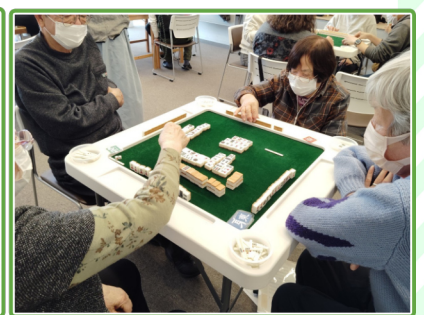
欲しい牌来るかな